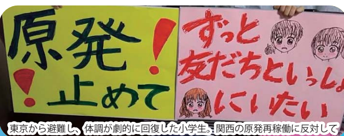
東京から避難し、体調が劇的に回復した小学生。関西の原発再稼働に反対して